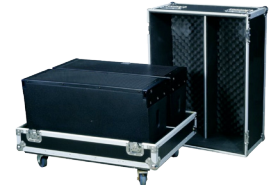
Boîte de vol