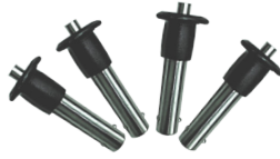
Pin De Suspensión